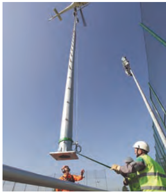
Mâts d'éclairage: du grand spectacle !