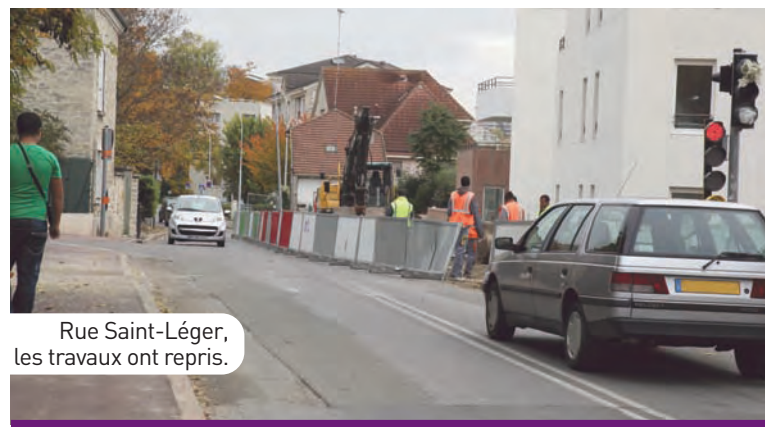
Rue Saint-Léger, les travaux ont repris.

En raison de la fermeture de l'escalier pour accéder à l'école des Sources depuis la rue Saint-Léger, vous êtes invités à accompagner vos enfants en passant par la ruelle Nicot et la rue Marcel-Aubert. Ce trajet est le plus court et le plus sécurisé. ♦