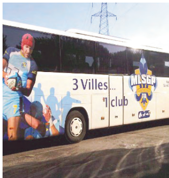
Le MLSGP a son bus

Les enfants du conseil municipal junior rencontrent les élus