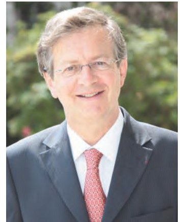
PAR EMMANUEL LAMY

Grâce à eux, Saint-Germain a pu rester la ville attrac- tive que nous aimons. Qu'ils en soient remerciés.