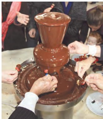
Fondez au Chocolat Show !