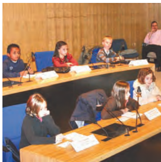
Le CMJ à l'Hôtel de Ville

Nouveaux mâts d'éclairage au stade Georges-Lefèvre : spectaculaire !