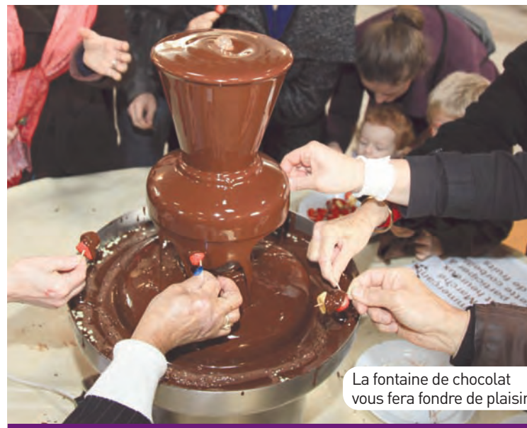
La fontaine de chocolat vous fera fondre de plaisir.

- Samedi et dimanche, à 11h30, présentation et dégustation de la recette noix de Saint-Jacques au gruë de cacao, par la boutique saint-germanoise Saveurs et Dégustations .