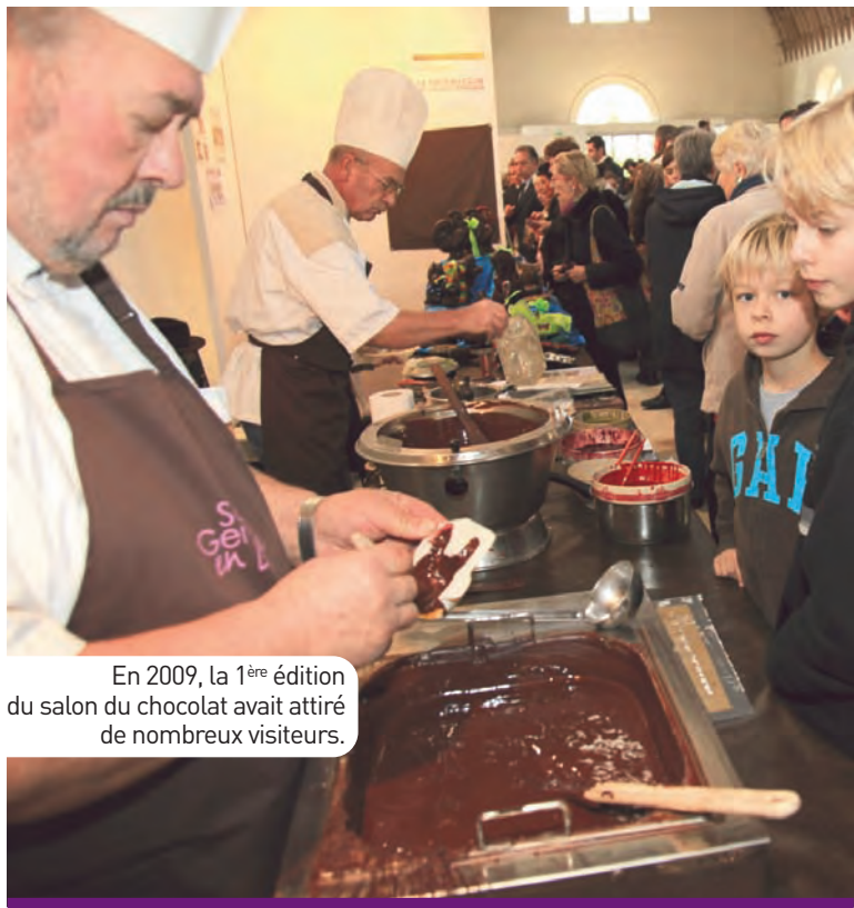
En 2009, la 1 ère édition du salon du chocolat avait attiré de nombreux visiteurs.