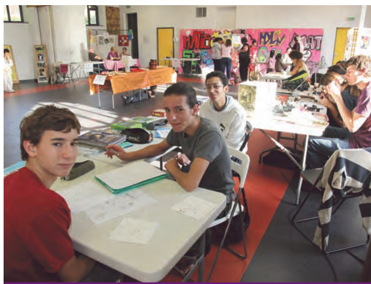
Samedi 9 octobre, La Soucoupe avait organisé des portes ouvertes afin de faire découvrir les multiples activités qu'elle propose.