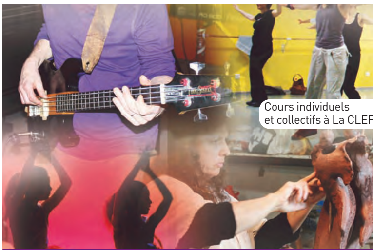
Cours individuels et collectifs à La CLEF.

► Activités ados-adultes : L'atelier "laboratoire" ados et adultes. Sculpture - Modelage ados et adultes. Peinture adultes niveau débutant. L'atelier d'improvisation ados. Danse hip-hop ados niveau débutant ; Danse orientale ados et adultes niveau intermédiaire/avancé. Danse salsa adultes tous niveaux. Danse de société adultes tous niveaux. Danse