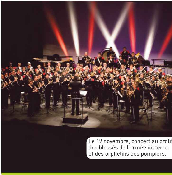
Le 19 novembre, concert au profit des blessés de l'armée de terre et des orphelins des pompiers.

Entrée : 10 euros. Réservation au 01 39 21 23 72.