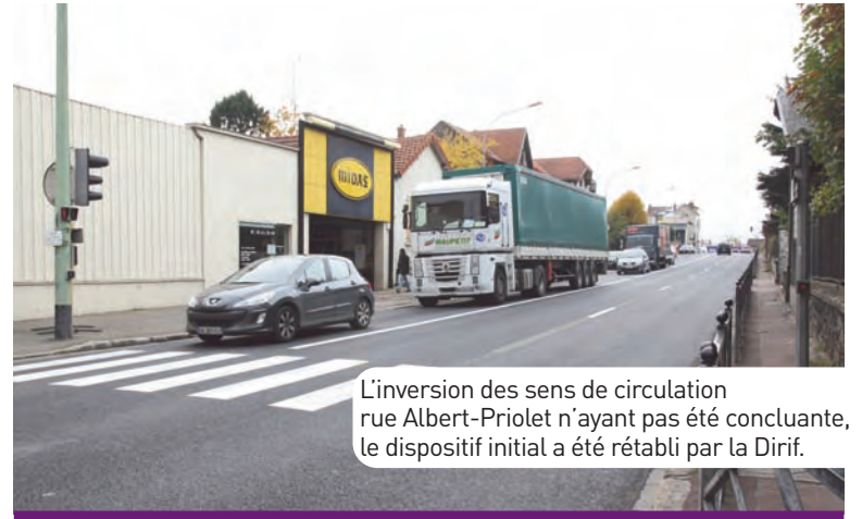
L'inversion des sens de circulation rue Albert-Priolet n'ayant pas été concluante, le dispositif initial a été rétabli par la Dirif.

Le dispositif proposé par la Mairie d'alterner le sens de circulation sur la