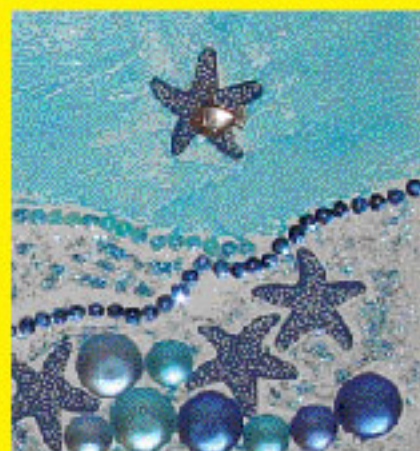
Exemples de création "Home déco".

> 6 et 13 mars : décoration de pots de confiture pour la fête des grands-mères