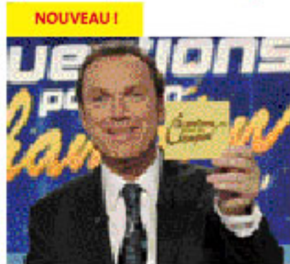
l'animateur Julien Lepers

Lundi 26 janvier Questions pour un champion