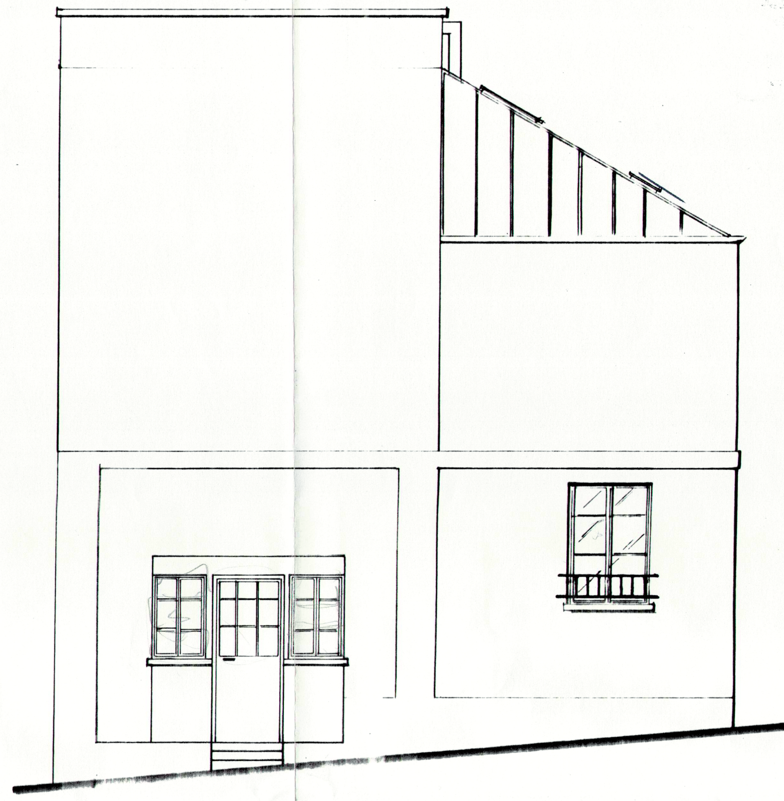
PIGNON COTE RUE