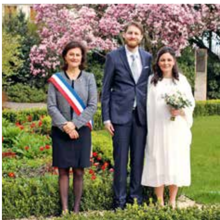
Samedi 9 mars • Par Priscille Peugnet Claire Bovyn & Quentin Toury