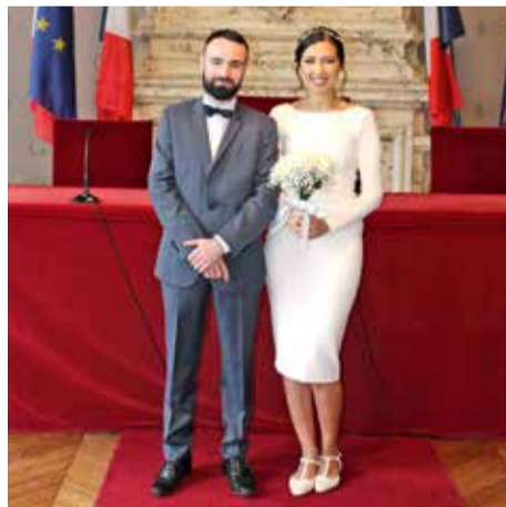
Samedi 9 mars • Par Priscille Peugnet Yasmine Lemoui & Nicolas Cailliot