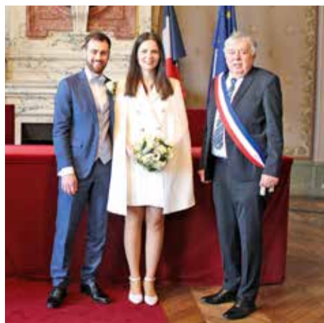
Samedi 16 mars • Par Maurice Solignac Juliette Mouzayek Kouz & Pierre Gagneux