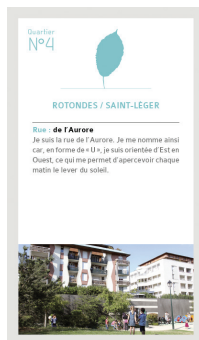
Jeu des 7 familles des 7 quartiers