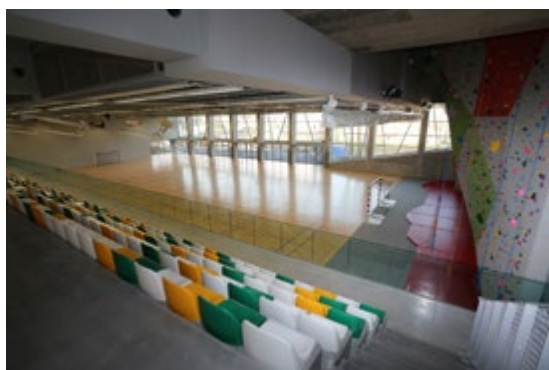
Gymnase des Lavandières