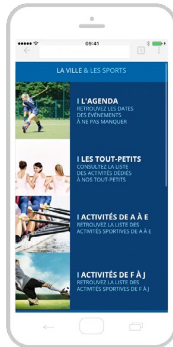
Guide des sports