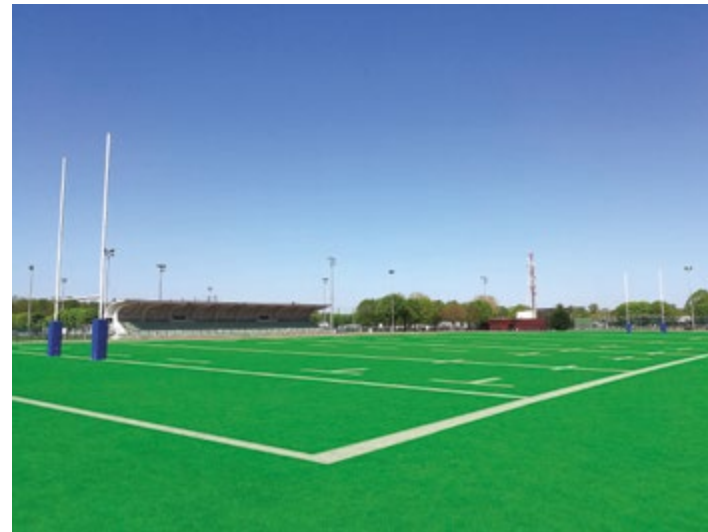
Projet terrain de rugby en surface synthétique (photomontage)