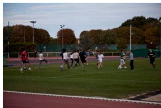
Stade municipal Georges-Lefèvre