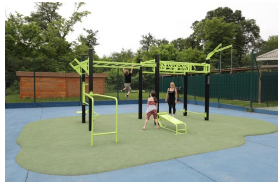
Forum des sports 2017