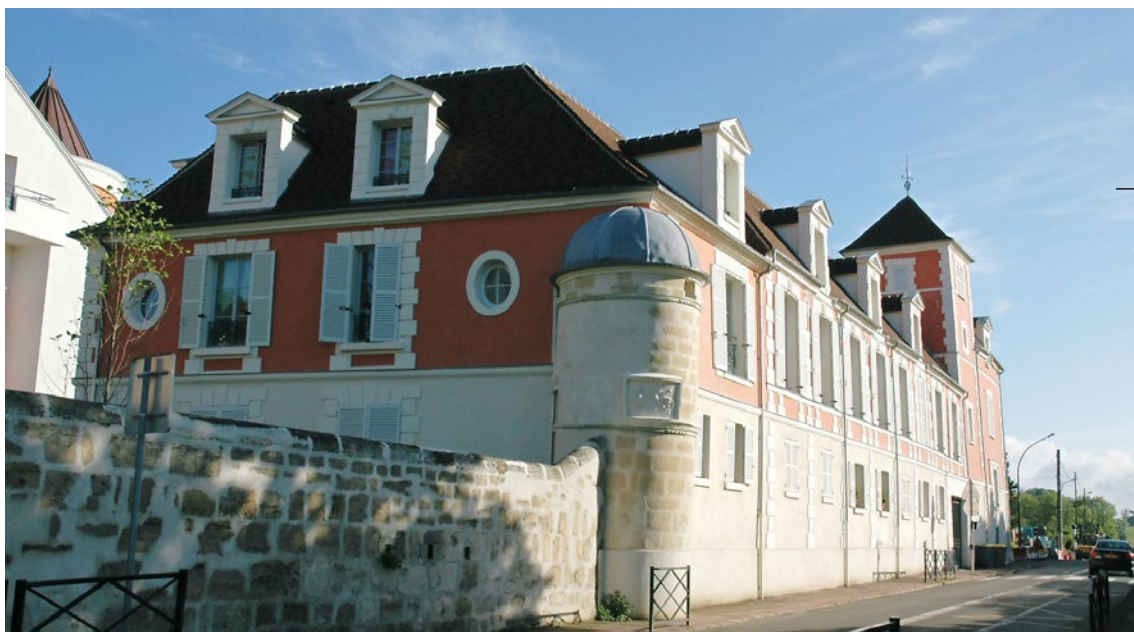
Le château de Vaux, au Mesnil-le-Roi