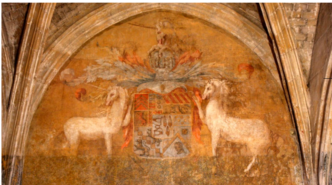
Armoiries des « de La Salle » capitaines gouverneurs du château de Saint-Germain au XVII e siècle.