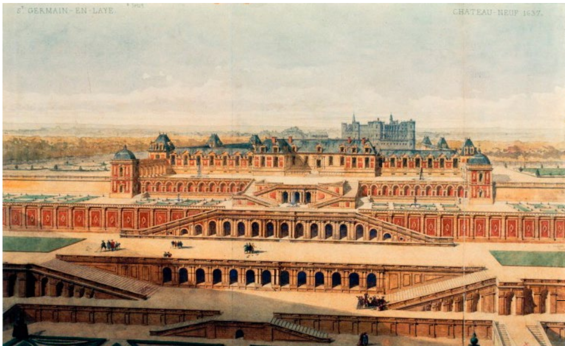
Le Château-Neuf de Saint-Germain-en-Laye en 1637, par Auguste-Alexandre Guillaumot.

De 1661 à l'installation définitive de la cour à Versailles en 1682, Louis XIV résidera plusieurs mois chaque année au Château-Vieux, délaissant le Château-Neuf dont les fondations semblent fragilisées.