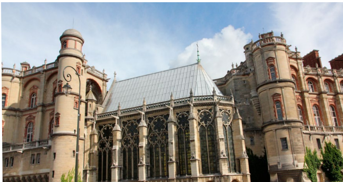
Le Château-Vieux et la chapelle royale

En visite à Paris en août 1855, la reine Victoria demande à faire un pèlerinage sur la tombe de Jacques II. Cet événement fait sortir de l'oubli le château de Saint-Germain-en-Laye : Napoléon III, passionné d'archéologie gallo-romaine, décide d'y créer un musée gallo-romain. Le musée des Antiquités nationales sera inauguré le 12 mai 1867.