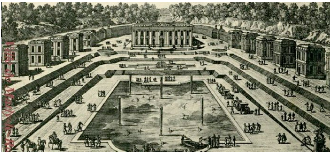
Le château de Marly, du côté des jardins

Le domaine royal de Marly naît de la volonté de Louis XIV de s'éloigner de la tumultueuse vie versaillaise. Ainsi, Louis XIV acquiert, en 1676, la baronnie de Marly-le-Chastel, en lisière des grandes forêts de chasse, pour y construire une nouvelle maison royale. Il confie à Jules Hardouin-Mansart le soin d'y construire une résidence plus intime que Versailles. L'aménagement du site commence en 1679. En 1684, la plus grande partie des travaux est achevée. L'originalité de ce château installé dans un écrin de verdure , réside dans son architecture éclatée . Les angles du pavillon sont occupés par les appartements du roi, de Madame de Maintenon, de Monsieur, frère du roi, et de Madame, son épouse. Les douze pavillons des invités se déploient de part et d'autre du bassin du Grand miroir. L'ensemble de ces bâtiments est peint en trompe-l'œil, à fresque. La polychromie des édifices s'intègre aux compositions végétales et concourt à l'impression d'un décor de théâtre.