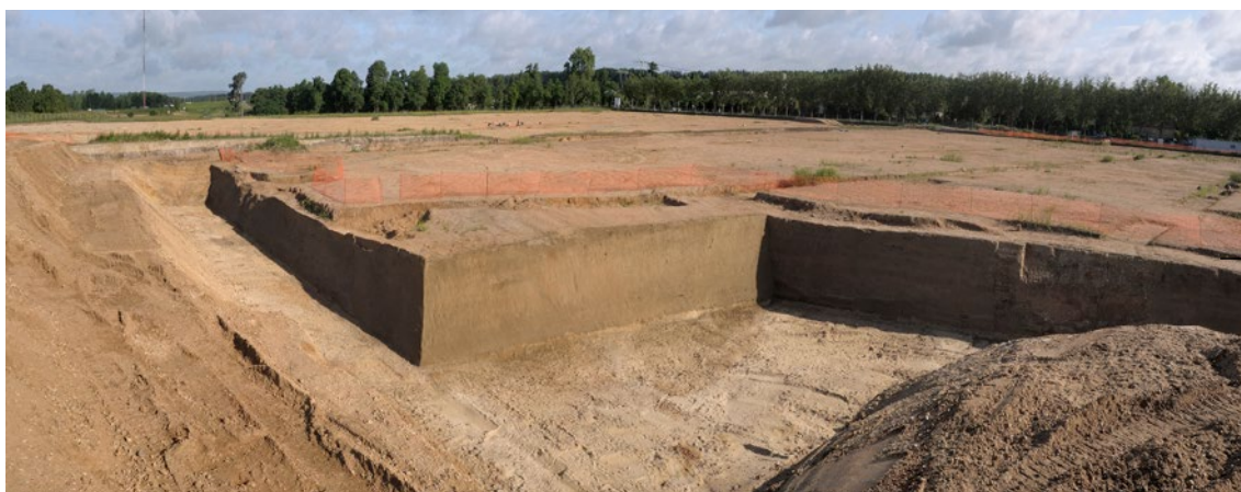
Le fort Saint-Sébastien tel qu'il fut mis au jour en 2010, à l'occasion de fouilles d'archéologie préventive.