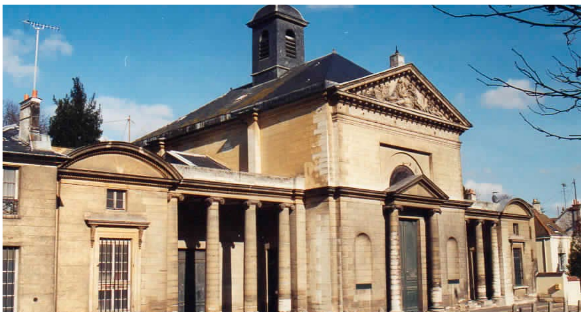
L'église Saint-Louis du Port-Marly

Les premières mentions du « port de la Loge » ou « port de Marly » dans les archives existantes remontent au XIII e siècle. C'est à l'initiative de Louis XIV, sous l'impulsion des besoins croissants de transports de marchandises liés à son installation à Versailles en 1682 que se développe fortement l'activité portuaire du site. Positionné sur la rive gauche de la Seine, où le lit du fleuve offre un chenal profond favorisant la navigation, le port de la Loge est idéalement situé. À cette même date (1682) est également construite la machine de Marly , énorme pompe destinée à alimenter en eau, depuis la Seine (au niveau de Bougival) le Grand canal et les bassins du parc de Versailles. Cet immense chantier modifie la physionomie du bras du fleuve à hauteur du port de Marly. En 1695, le roi donne par lettres patentes la primauté au port de Marly sur celui d'Aupec (Le Pecq) pour les besoins d'approvisionnement des domaines royaux du château de Marly et de la cour de Versailles. Au XVIII e siècle, le trafic de marchandises du port se développe fortement. C'est dans le dernier quart de ce siècle que le village va vivre sa mutation la plus profonde. En 1778, le roi Louis XVI pose la première pierre d'une chapelle au port de Marly et en 1785, l'archevêque de Paris érige la chapelle. Ce nouveau cœur de village, servira d'argument aux habitants du petit « canton » de Marly, riverains de la Seine, pour demander leur détachement de Marly et la création d'une commune autonome en 1790.