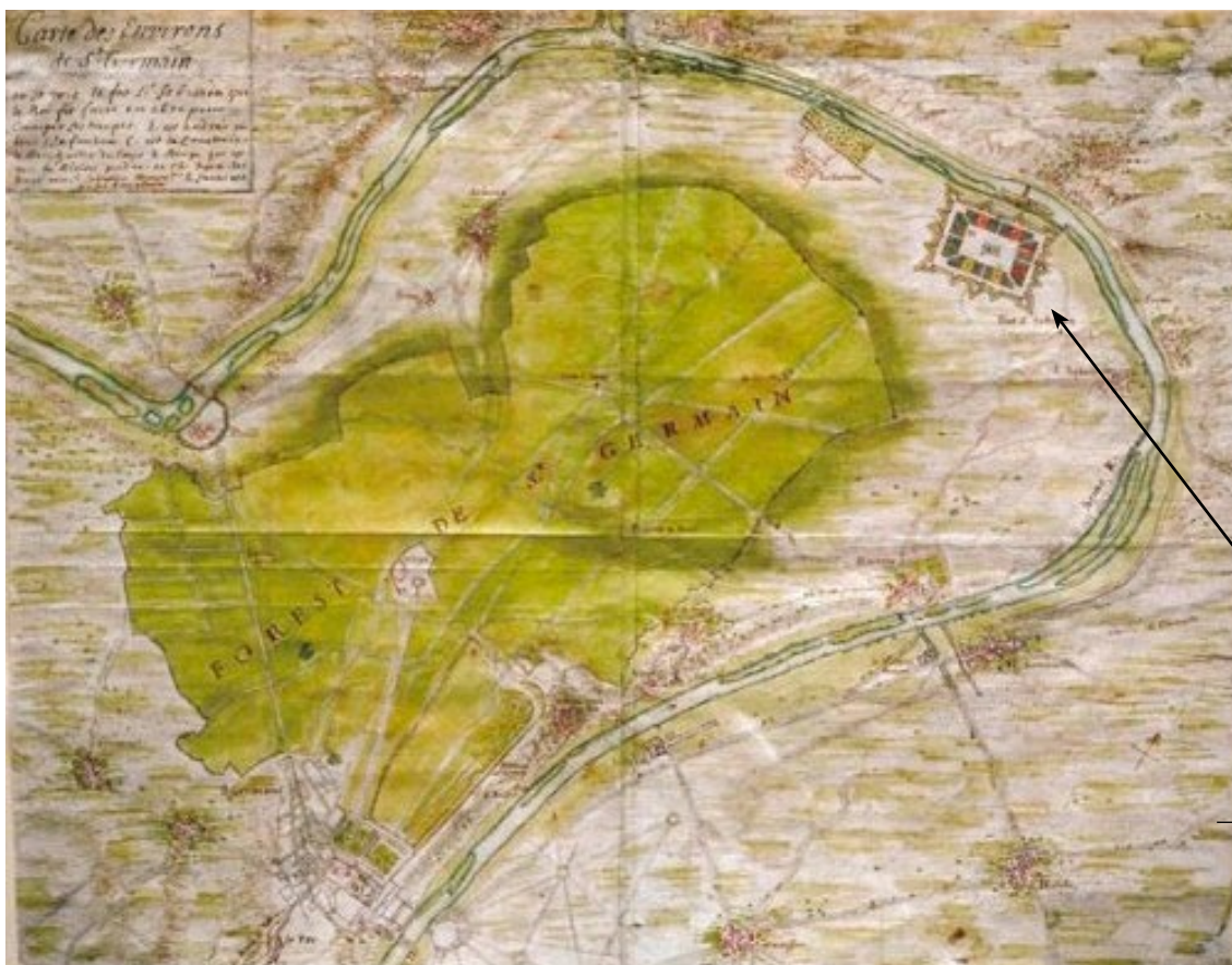
Le fort Saint-Sébastien figure à droite sur cette carte, au nord de la forêt et sur la rive gauche de la Seine.

Sa construction est liée à un contexte précis : la fin récente de la guerre de Dévolution contre l'Espagne, le souhait du jeune Louis d'affirmer sa puissance surtout vis-à-vis des Provinces-unies (Pays-Bas). Mais son armée n'est pas suffisamment préparée à les affronter et à prendre des forteresses et c'est à cette fin qu'est érigé le fort. La technique militaire connaît également un tournant à cette époque, passant d'une armée d'enrôlés de force à une armée de métier dont les fonctions se spécialisent : artilleurs, grenadiers, sapeurs, piquiers. Le fort va donc servir à leur entraînement.