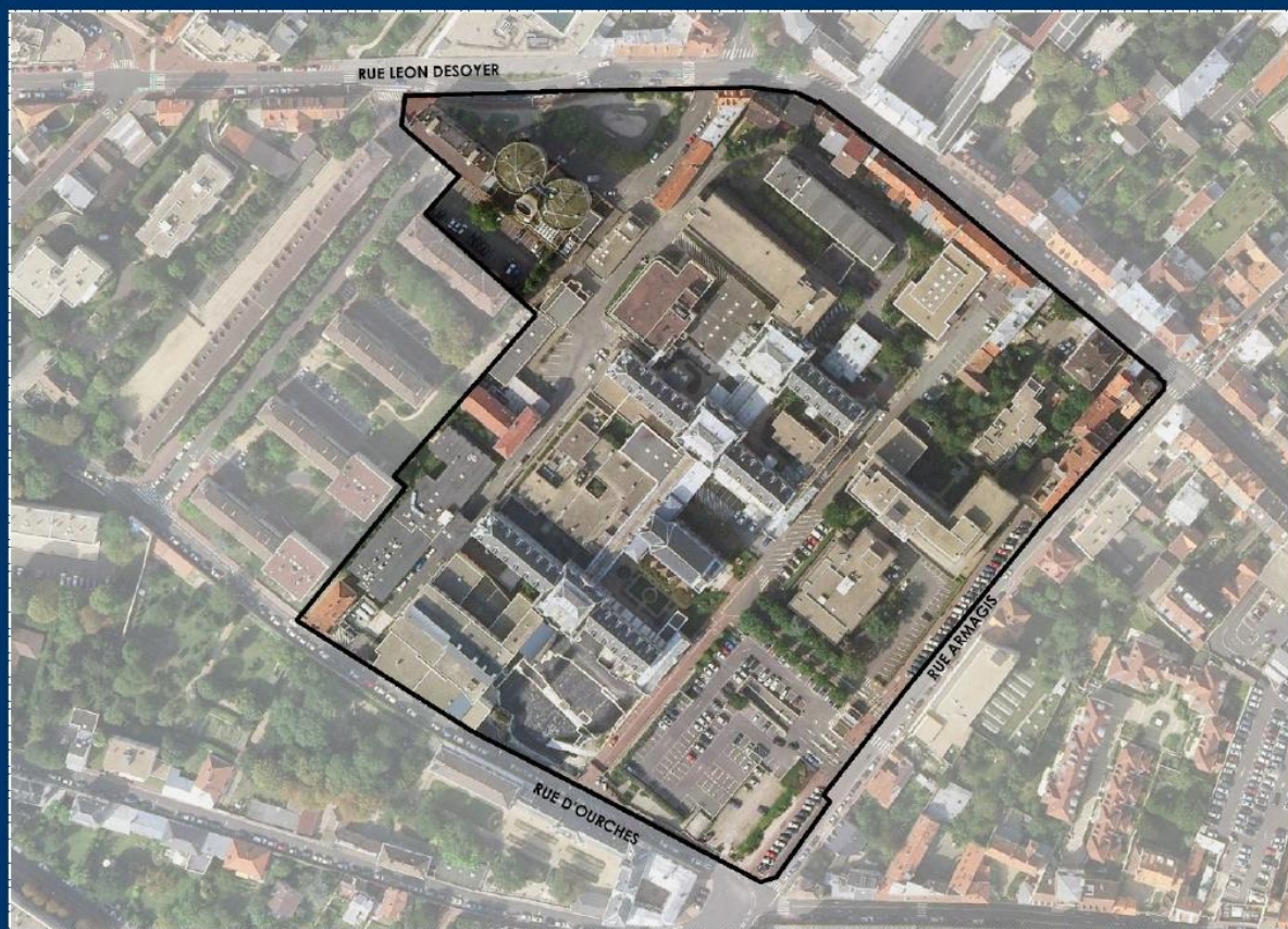
Ville de Saint-Germain-en-Laye

Certains bâtiments ont vocation à être démolis, notamment les pavillons Nivard, Courtois, Salet, Dunant, Petit, la crèche, l'IFSI... Ce projet fera l'objet d'une concertation dans les prochains mois. L'idée est d'aménager le périmètre de 40 000 m 2 autour de la construction de logements, d'activités de para santé et d'un urbanisme commercial en conservant des espaces verts.