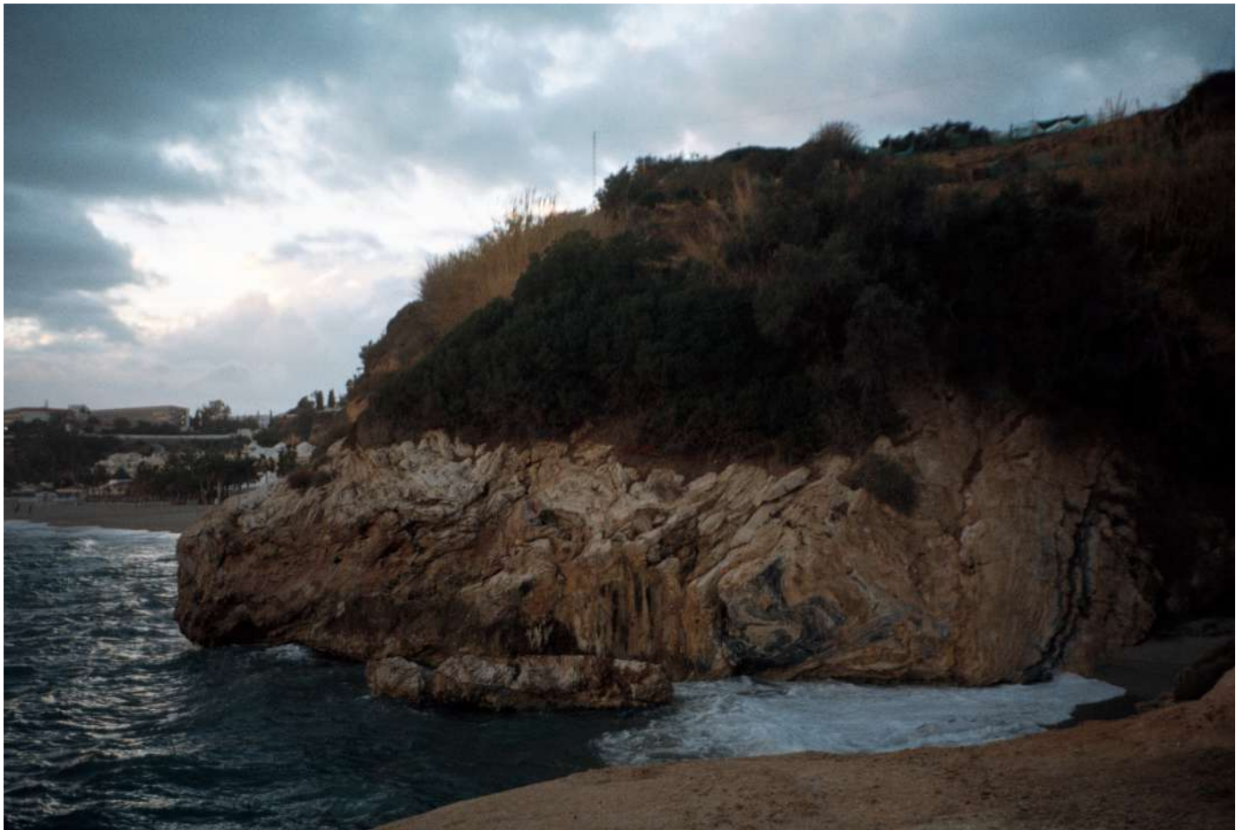
Agathe Petiot, Sud de l'Espagne, décembre 2021