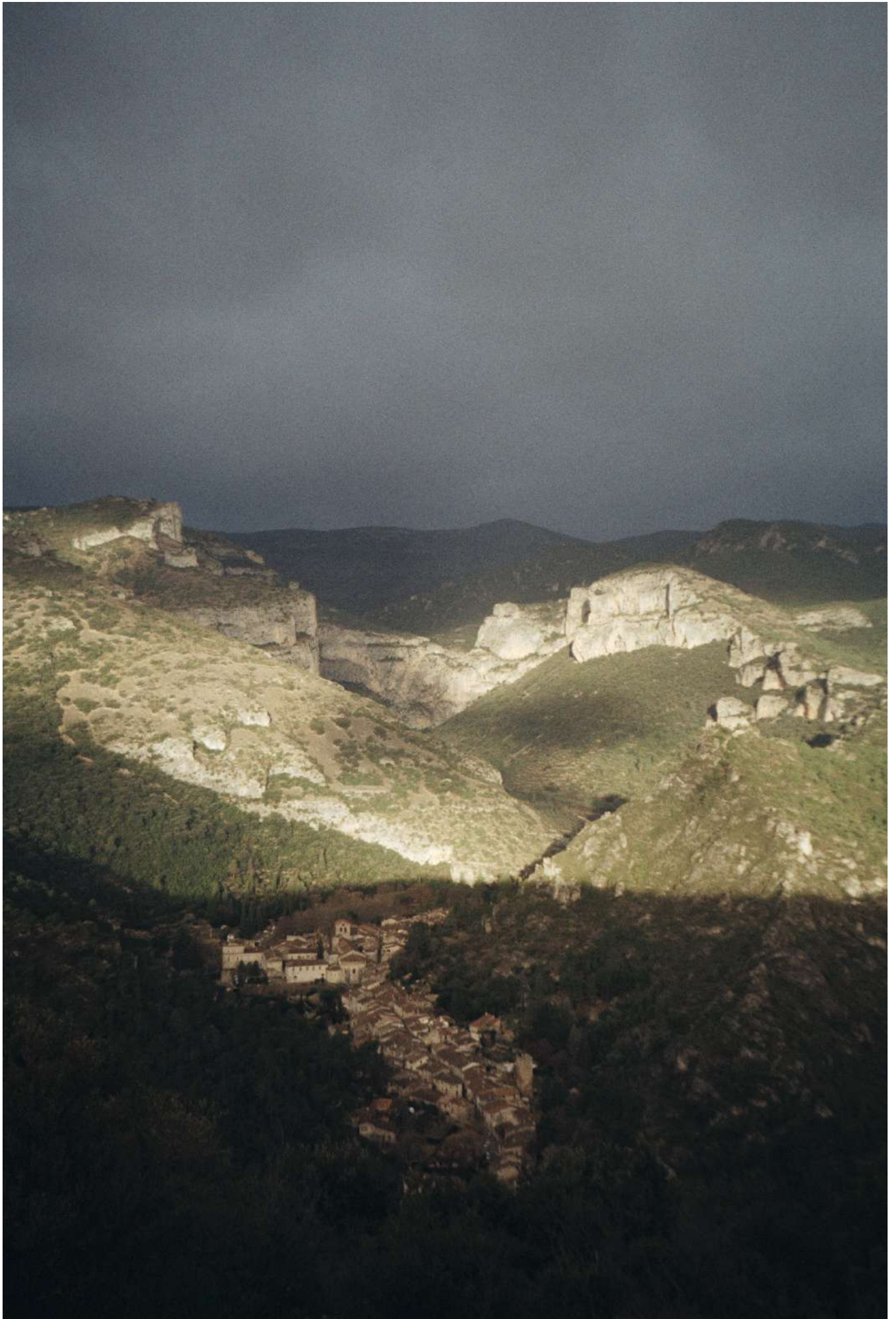
Agathe Petiot, Espagne, janvier 2022