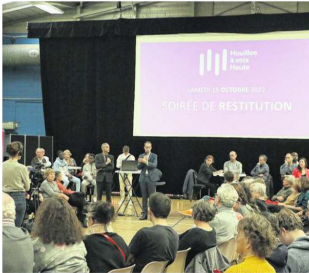
300 Ovillois étaient présents samedi 15 octobre, salle Ostermeyer pour la restitution de Houilles à voix haute.

Sur d'autres thèmes : renforcer la dynamique commerciale ; organiser un salon de l'écologie citoyenne ; créer un espace de télétravail ; faire de Houilles une