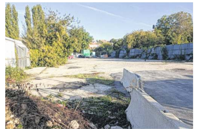
La casse, rue Claude-Monet, sera transformée en parking d'ici janvier 2023.

Les choix de projets étaient limités sur un terrain situé en zone inondable. Le choix s'est porté vers un parking pour désengorger et éviter le stationnement sauvage le long des bords de Seine de la ville impressionniste. « La justification du